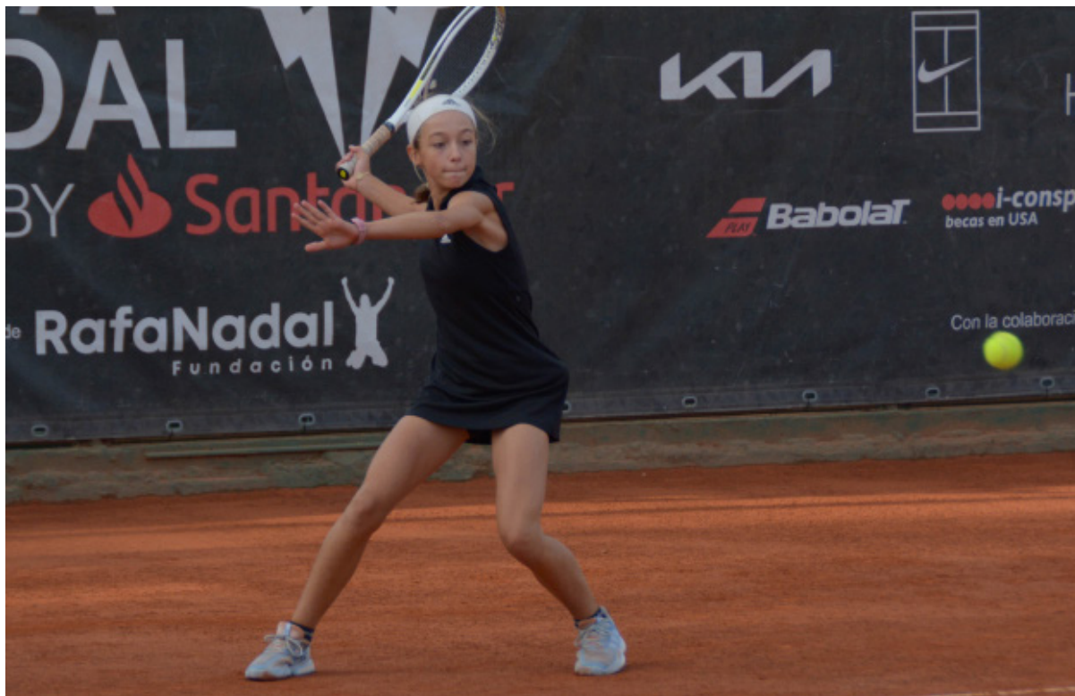
Partido del Rafa Nadal Tour by Santander

Este año hemos celebrado la 9ª edición del Rafa Nadal Tour , circuito juvenil de tenis solidario que nació en 2014 impulsado por el propio Rafael Nadal a beneficio de la Fundación Rafa Nadal, con la voluntad de completar la competición deportiva con una vertiente educativa.